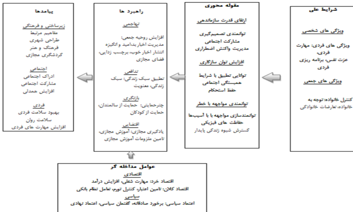
شکل ۱- الگوی تاب آوری جمعی در بحران های عالم گیر