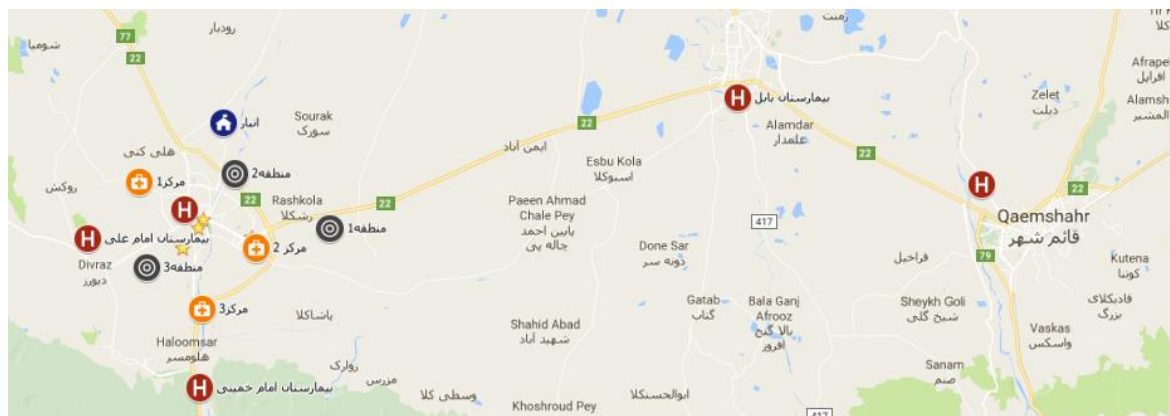
تصویر ۲: موقعیت جغرافیایی و نقشه ی محدوده ی مورد مطالعه در این تحقیق

پس از انجام عملیات امداد و نجات، مجروحان باید به بیمارستان ها و مراکز درمانی موقت منتقل شوند که این بیمارستان ها و مراکز درمانی موقت دارای ظرفیت محدودی برای پذیرش هر نوع مجروح هستند. سه مکان برای راه اندازی مراکز درمانی موقت که به صورت چادرهای امدادی ۲۴ نفره است، در نظر گرفته شده که پارک بنفشه، پارک بانوان و مدرسه ی لاری به این امر اختصاص یافته اند که این نقاط به کمک نظرات کارشناسان حادثه و با توجه به معیارهایی همچون نزدیکی به نقاط تقاضا، شدت بحران، استحکام منطقه و غیره انتخاب شده اند. سه بیمارستان ۱۷ شهریور، امام علی و امام خمینی در شهر آمل به دلیل نزدیکی به نواحی حادثه دیده و همچنین دو بیمارستان در شهرهای قائم شهر و بابل، به دلیل ارائه ی خدمات عمومی و تخصصی مناسب در نظر گرفته شده اند. ظرفیت پذیرش