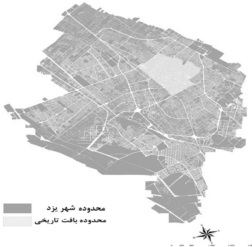
تصویر شماره (۱): موقعیت محدوده‌ی بافت تاریخی در شهر یزد